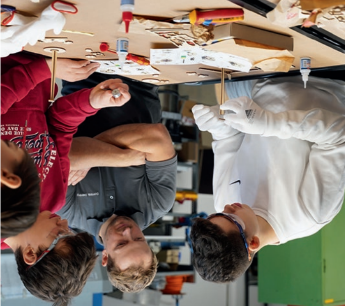
Euer Team „Tag der Ausbildung“

Liebe Schülerinnen und Schüler ab Klasse 8, der 20. November 2024 ist bei euch im Kalender hoffentlich bereits markiert. Wir bieten euch an diesem Tag ein wirklich spannendes Angebot: eine ganze Vielzahl an Bustouren von Ichenhausen aus zu jeweils 3 bzw. 4 Ausbildungsbetrieben in der Region. Nach beruflichen Schwerpunkten sortiert, von den Branchen her aber zum Teil auch bunt gemischt, geht es zu insgesamt 79 engagierten Arbeitgebern – vom innovativen Geheimtipp, vor Ort erlebt ihr eine ganze Menge interessanter Ausbildungsberufe – live und in Farbe. Ihr könnt Fragen stellen, rein-schnuppern, mit anpacken, Azubis kennenlernen und euch ein gutes Bild von ausgewählten Betrieben und Betrieben machen. Wählt die Tour eurer Wahl und steigt ein! Wir zeigen euch, wo Ausbildung läuft!